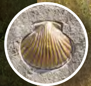
Jakobsmuschel als Erkennungszeichen auf dem Jakobsweg

Seit Jahrhunderten wird gepilgert. Vermutlich waren es irische Mönche, die sich im 6. Jahrhundert zuerst auf den Weg machten. Sie taten es Abraham nach, dem Gott aufgetragen hatte, loszuziehen. Im Mittelalter ist Pilgern ein Boom. Als Christ geht man nach Jerusalem, Rom oder Santiago de Compostela. Herkunft und Bildung sind dabei Nebensache, weshalb sich gerade auch Menschen aus unteren Schichten dafür begeistern. Gepilgert wird aus religiösen Gründen: für das Seelenheil, aus Dankbarkeit, als Buße, um nicht ‚in der Hölle schmoren zu müssen‘. Dafür nehmen Pilger Gefahren und immense Strapazen in Kauf. Im 15. Jahrhundert kommt Abenteuerlust dazu, Neugier auf fremde Länder und Kulturen. Im Spätmittelalter bringen sogenannte Berufspilger das spirituelle Reisen in Verruf. Sie machen sich im Auftrag reicher Leute auf den Weg, lassen sich für die Strecke bezahlen, mit der sich der Auftraggeber dann brüstet. Unter dem Einfluss von Martin Luther, der das Pilgern als Narrenwerk verspottet, ebbt es während der Reformationszeit ab. >