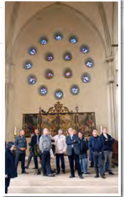
Dom-Besichtigung: Freizeit für die Konferenzteilnehmer

Einmal im Jahr ist DJK-Bundeskonzferenz der Geistlichen Beiräte. Dann kommt das kirchliche Gremium des katholischen Sportverbandes, dem die Geistlichen Beiräte der DJK-Diözesan- und DJK-Landesverbände angehören, zusammen und tauscht sich über Kirche und Sport aus. Gastgeber der diesjährigen Konferenz war im Mai der DJK-Sportverband Diözesanverband (DV) Münster.